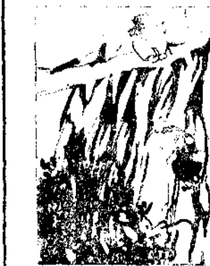
—¡Auxilio! ¡Por María Santísima! Socorro. Una cuerda, por favor. ¡¡Pronto!!