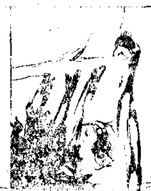
—Que llegue a tiempo, Dios mío!