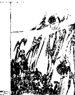
—Espere un momento.